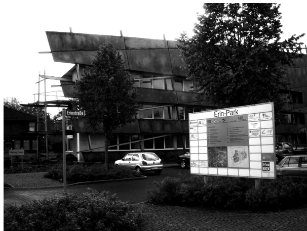
IBA-Projekt: Arbeiten im Park

Dieser Weg muss fortgesetzt werden und wird auch fortgesetzt, gerade bei den aufgegebenen Zechenbrachen nach den jüngsten Schließungen von Zechenstandorten. Auch die Inhalte und die Formen der IBA werden weiterverfolgt, z. B. auf den ehemaligen Zechenstandorten Hugo in Gelsenkirchen und Ewald in Herten. Die IBA hat Mut bewiesen, neue Themen anzugehen, Landmarken zu setzen und neue Identitäten zu stiften. Kritisch ist anzumerken, dass es derzeit nicht in ausreichendem Maße gelingt, den durch die IBA angestoßenen Bewusstseinswandel durch ähnlich wirksame Aktivitäten der Öffentlichkeitsarbeit weiter fortzuführen.