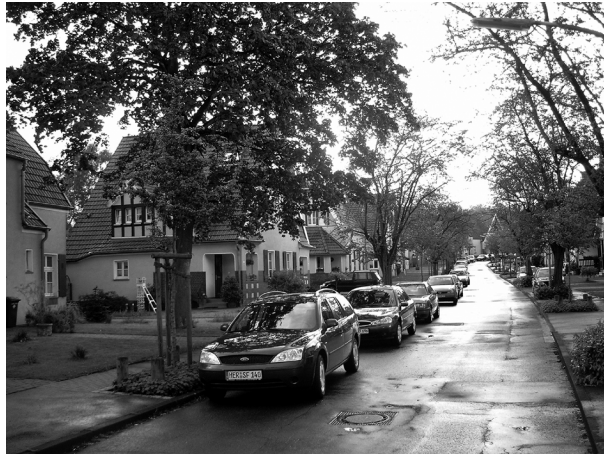
IBA-Projekt: Erhaltung und Erneuerung Arbeitersiedlung Teutoburgia in Herne

Was man nicht weiß, gibt es in den Köpfen der Menschen nicht. Daher haben wir sehr viel Kommunikation nötig – aber eine überlegte Kommunikation. Man kann sie weder der Werbung noch irgendeiner Zunft-Enge anvertrauen.